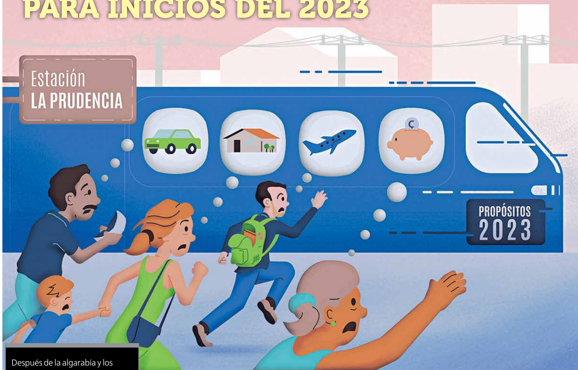
Ilustración: Jeisson Sibaja

Después de la algarabía y los rituales de año nuevo, los ticos aterrizan en una árida realidad en la que sus ilusiones no podrán echar raíces. Economistas de la Universidad Nacional (UNA) invitan a la población a “socarse la faja” y abstenerse de solicitar préstamos, pues según vislumbran los expertos la recuperación del empleo será lenta y el crecimiento poco.