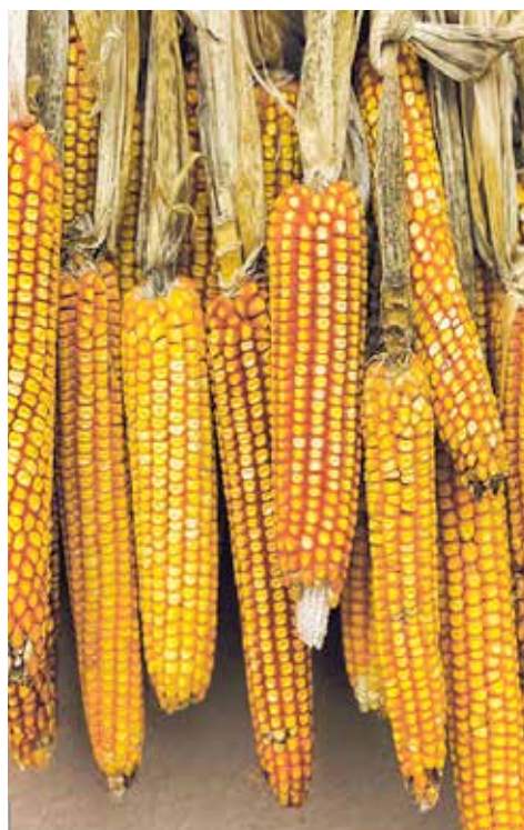
El maíz es originario de Mesoamérica y en Costa Rica se remontan a 3.000 años a.C. La cultura del maíz se manifiesta en múltiples tradiciones, usos sociales, conocimientos y expresiones asociadas con cultivo, cosecha y procesamiento del grano.

diaria, correspondientes a 1960-1962 (FAO, 1966), eran superiores a las de 1979 en algunos países.