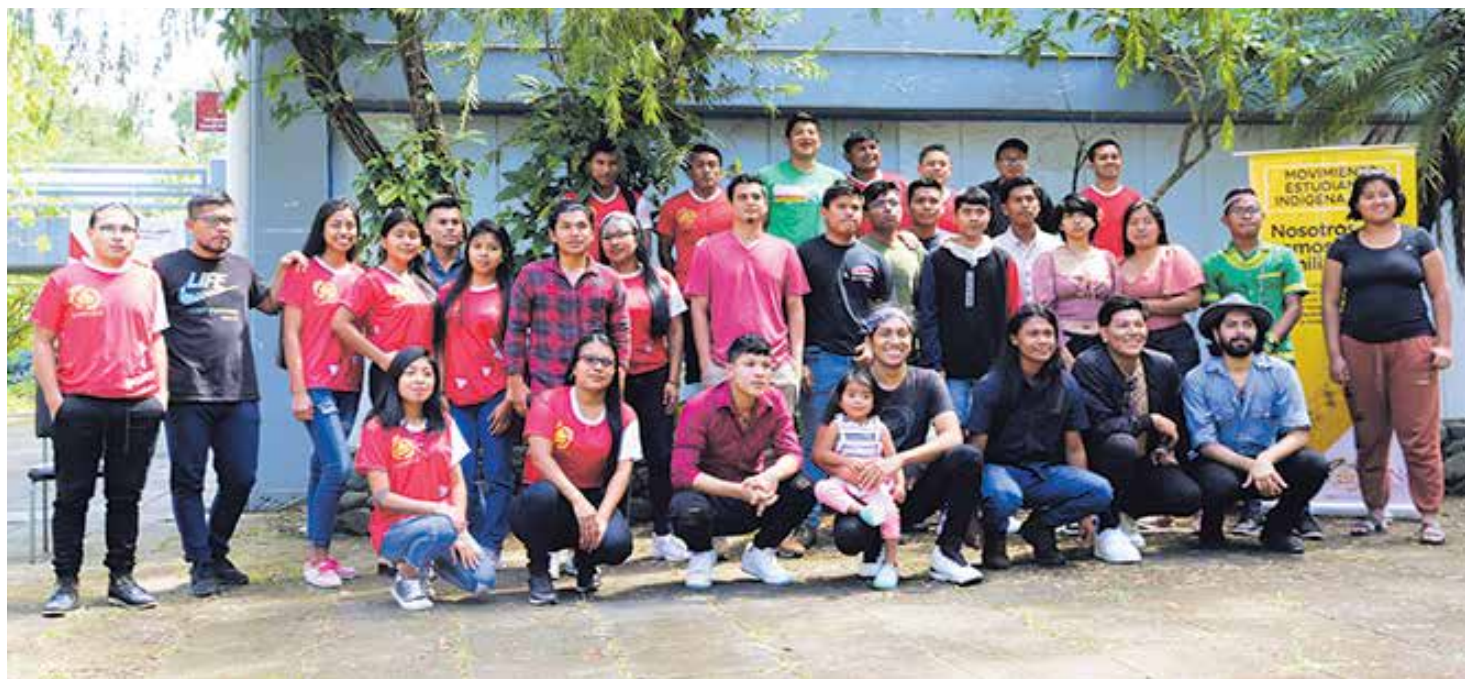
Estudiantes indígenas se reunieron en el VI Festival Intercultural en la UNA, con el objetivo de visibilizar el aporte de los pueblos originarios.

El programa de la celebración de las culturas indígenas costarricenses continuó