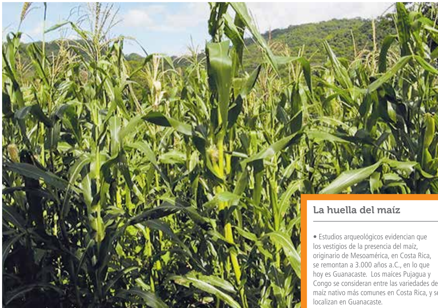
El maíz es la base de la alimentación, y protegerlo es un desafío que enfrentan productores, investigadores y autoridades del sector.

Datos de la Organización de las Naciones Unidas para la Agricultura y la Alimentación (FAO) revelan la importancia que este producto ha tenido en nuestra cultura; para el período 1979-1981, se consumían más de 100 g de maíz por persona por día en 22 de 145 países incluidos en las estadísticas. Incluso las cifras de las hojas de balance de alimentos de la FAO sobre la ingesta de maíz y su aportación de calorías y proteínas a la dieta