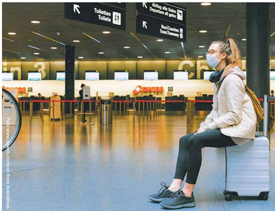
con fines ilustrativos