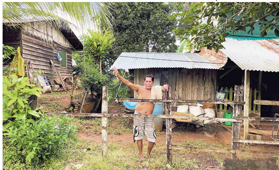
con fines ilustrativos