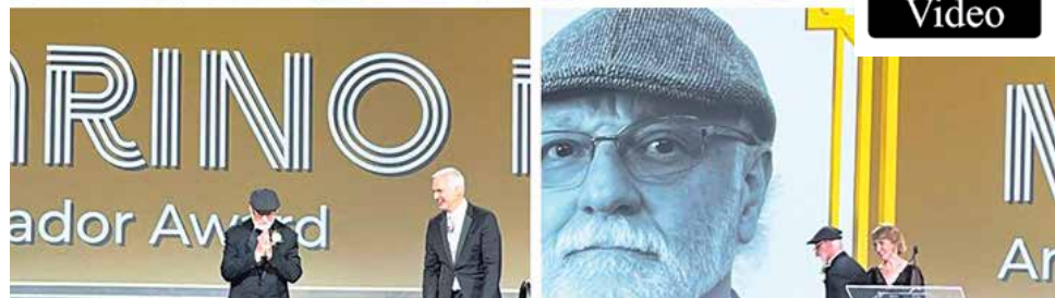
Ceremonia de entrega Premio Embajador de la Unión de Geofísica Americana (AGU por sus siglas en inglés).

geomorfología, geoquímica, hidrología, meteorología, mineralogía, oceanografía, paleomagnetismo, petrología, prospección geofísica, sismología, tectonofísica y vulcanología, entre otras.