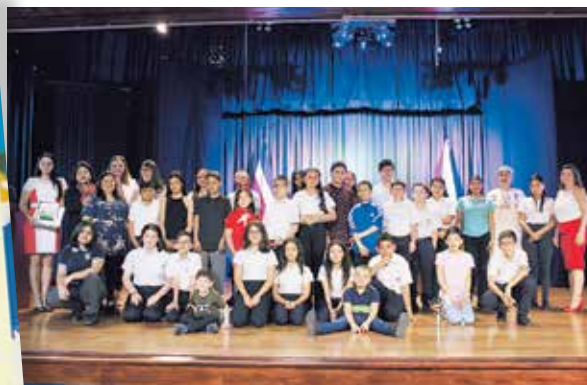
Un grupo de 41 estudiantes de la Regional de Heredia del MEP participaron en este proyecto.