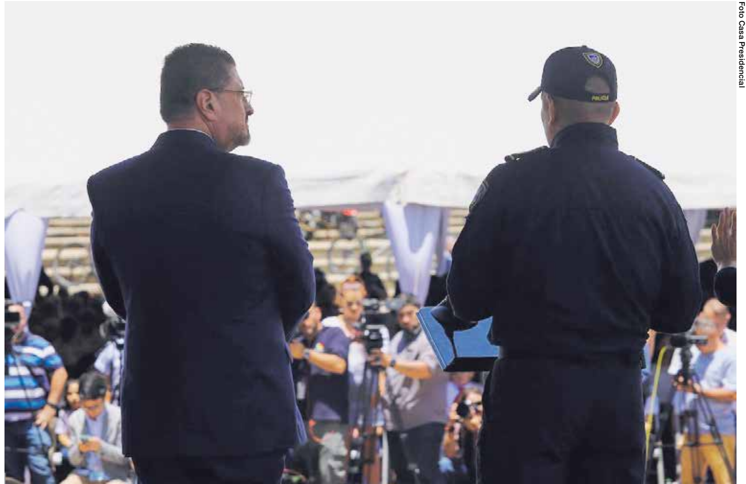
El 19 de abril el Gobierno presentó el plan denominado “Operación Costa Rica Segura”; en lo que se interpretó como un reconocimiento de que sí existe una crisis.