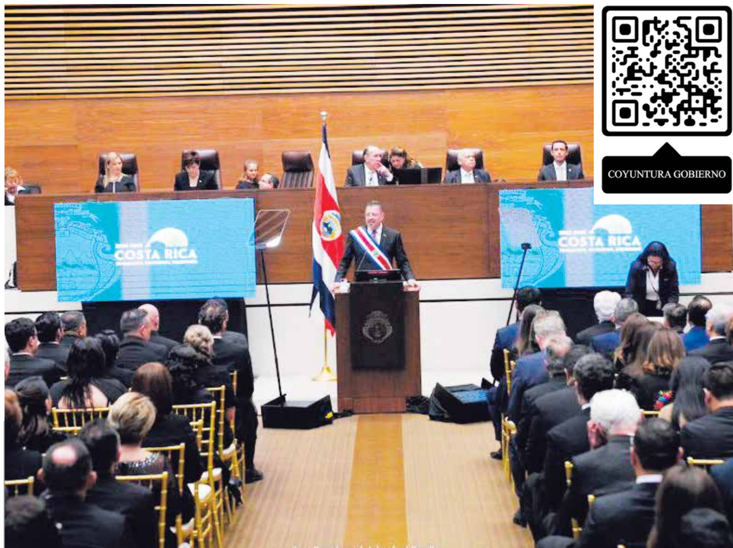
Según el análisis del sociólogo Carlos Carranza, la inestabilidad en el Gobierno Chaves Robles ha sido un punto en contra para la toma de decisiones.

Otro tema fundamental es el de mejorar la seguridad y, como contexto, la violencia estructural. Esta violencia estructural tiene que ver con la presencia o ausencia del Estado en suplir las necesidades básicas que una comunidad necesita para salir adelante, y la valoración de los expertos es que Costa Rica se enfrenta cada vez más a una creciente desigualdad social. Este indicador, según el Banco Mundial, en este momento se encuentra en un 48.7, aunque ha tenido momentos aún más críticos, como en el 2002 cuando llegó a un 51.8. Si a este dato de desigualdad se le suma la tasa de desempleo, el panorama se complejiza.