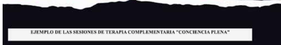
EJEMPLO DE LAS SESIONES DE TERAPIA COMPLEMENTARIA "CONCIENCIA PLENA"

Es indispensable para la mejora de procesos atencionales la aplicación de la terapia de conciencia plena en pacientes con algún tipo de alteración craneoencefálica.