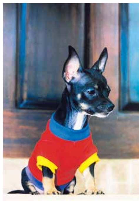
Relacionar la humanización con la agresión en los perros no es atinente, pero si se pretende que el animal use determinado vestuario de los humanos podría resultar contraproducente para el can.

Jiménez recalcó que vincular la humanización con la agresión en los perros no es atinente, pero si se pretende que el animal use determinada prenda propia de los humanos podría resultar contraproducente para el can; sin embargo, esto tampoco quiere decir que vayan a ser agresivos.