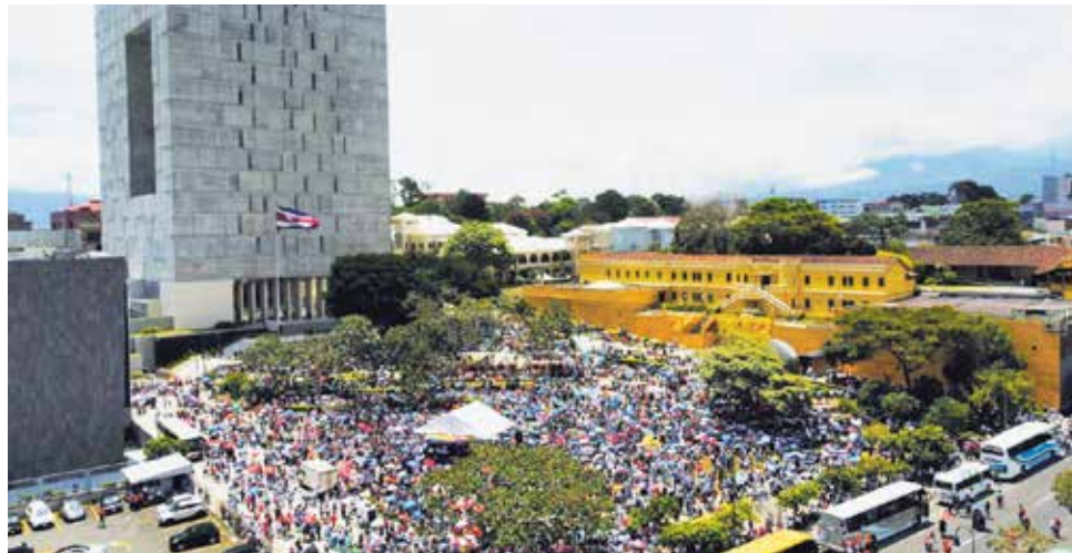
La multitudinaria marcha por la educación pública del pasado 20 de junio significó un gran respaldo para las universidades. En las universidades se alega que se les vienen aplicando recortes sistemáticos desde 2019.

Este año, ese 1% pendiente ha sido el punto de discordia. En tres sesiones (2, 13, 20 de junio) de la Comisión de Enlace, encargada de negociar el presupuesto, no ha habido acuerdo. Cuando el pasado 13 de junio el Ministro de Hacienda, Nogui Acosta, anunció que el gobierno no iba