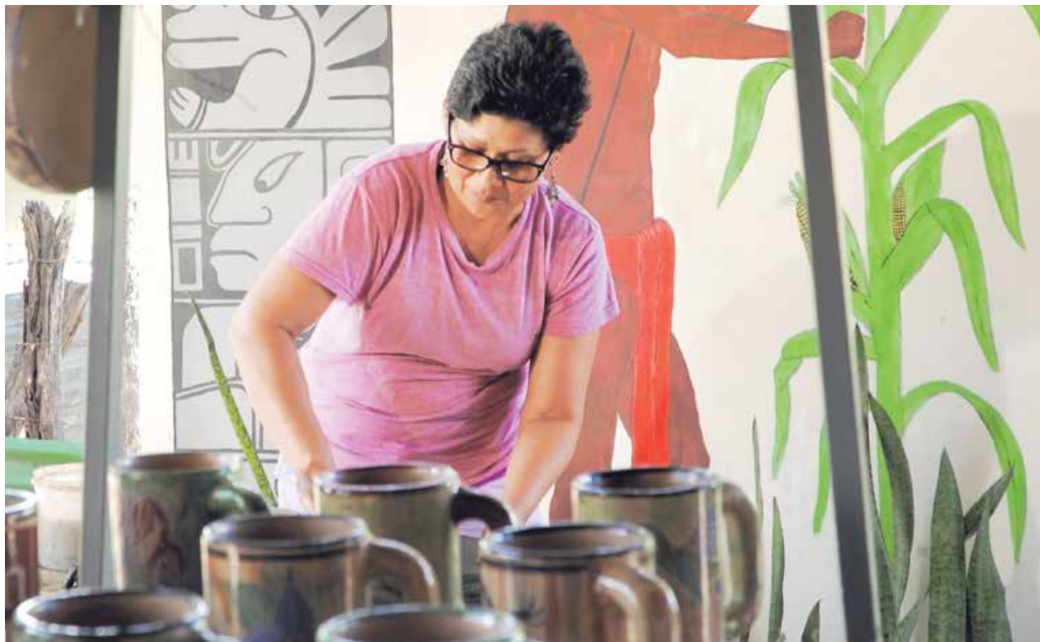
La cantidad de mipymes del país es muy amplia, pero el abordaje debe ser diferenciado según el territorio en el que surjan, dadas las necesidades de crédito, capacitación y facilidades propias de cada lugar, alertó especialista de la UNA.

Los especialistas coinciden en que el emprendimiento y los negocios informales fueron la clave para que muchas familias costarricenses sortearan la crisis económica y de desempleo ocasionadas por la pandemia. Montero explicó que esto se debe a que las pequeñas empresas promueven el encadenamiento productivo, lo que permite que una empresa se