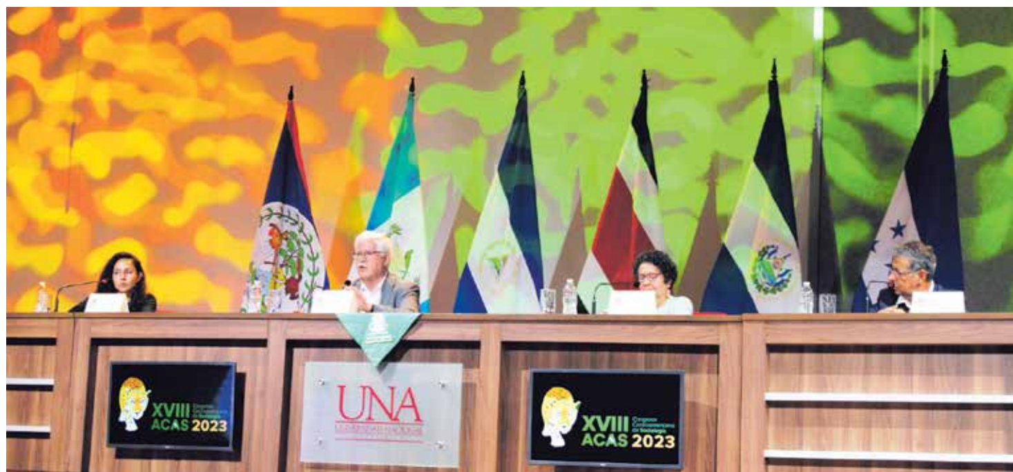
El XVIII Congreso ACAS 2023, que se realizó en la UNA del 5 al 9 de junio, convocó a expertos de la región para reflexionar sobre las problemáticas a las que se enfrenta la sociedad centroamericana actual.

Paralelamente a la crisis de desigualdad social y pobreza en la región, se convive con la violencia en todas sus formas.