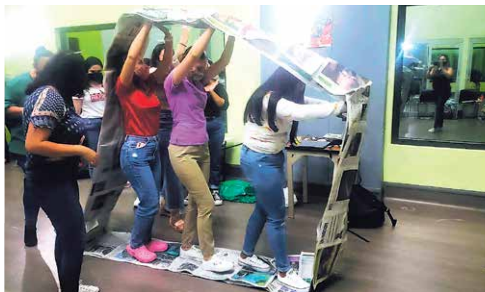
Uno de los principales retos de la carrera es aumentar la participación estudiantil en los procesos de evaluación docente.

Como parte de los resultados de este proceso de autoevaluación, destacan entre las fortalezas de la carrera, el impacto de la