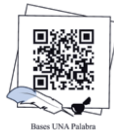
Bases UNA Palabra

La recepción de obras estará abierta hasta el 13 de agosto 2023 en las ramas de poesía, dramaturgia y novela.