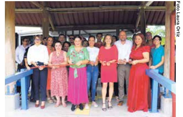
El 1 de junio se inauguró la nueva infraestructura del campus Cotos: nuevos espacios para aulas, oficinas administrativas y soda comedor.

“Estas instalaciones representan una inversión responsable de aproximadamente 1000 millones de colones destinados a cientos de jóvenes de esta región.