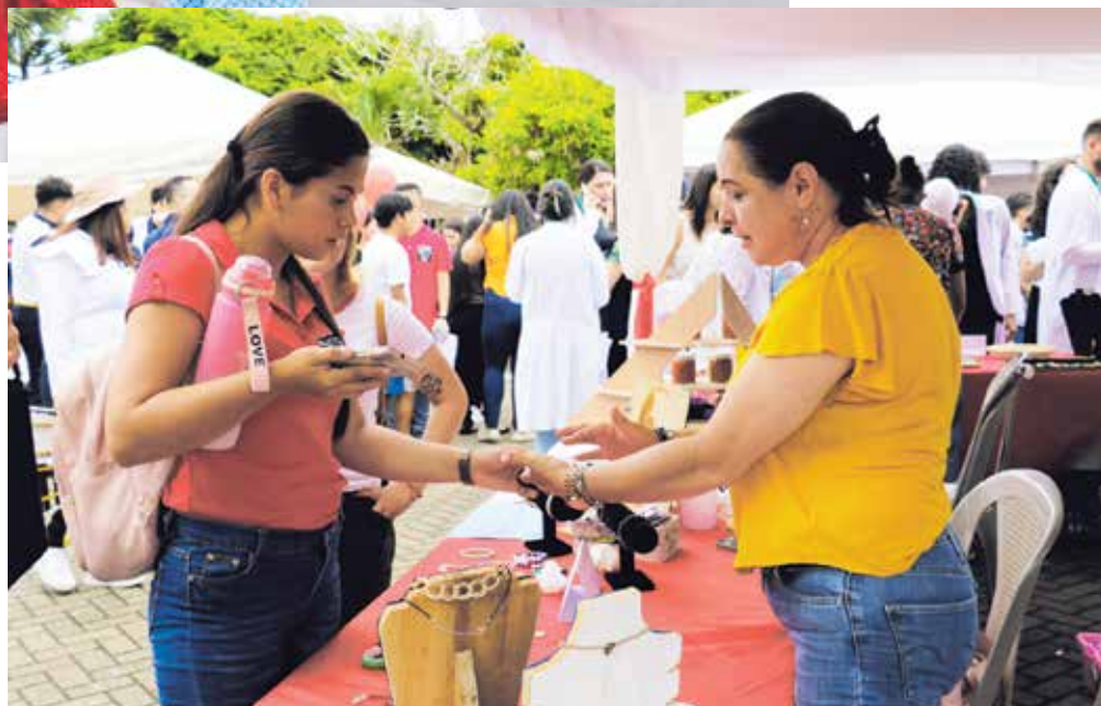
Decenas de emprendedores se dieron cita en el parque de San Isidro del General para presentar sus productos y ser parte de la celebración del 50 aniversario de la UNA