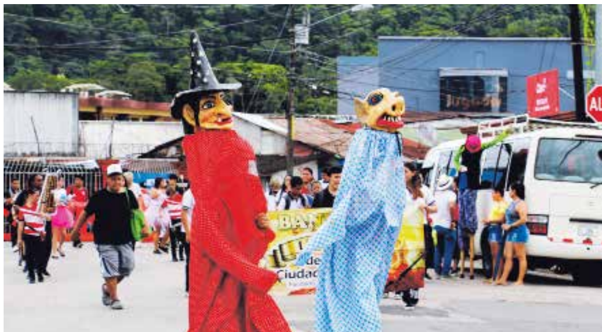
Pasacalles de la UNA fue protagonista en las actividades realizadas en el parque de Ciudad Neilly.

“Debemos sentirnos orgullosos de que en este cantón contemos con una sede de la