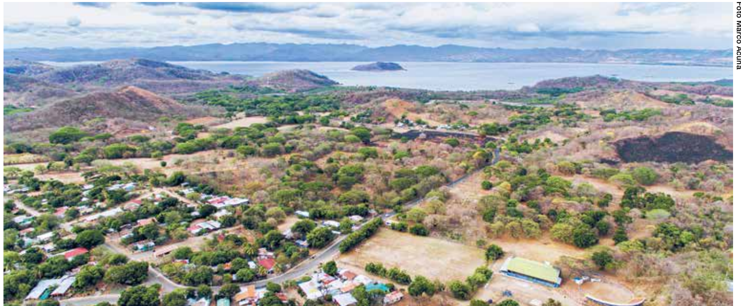
En criterio de especialistas, se requieren más esfuerzos de educación y promover acciones para adaptarse a la amenaza de seguridad hídrica.

La estacionalidad marcada en la zona impacta la percepción de que la falta de agua no es un problema, pues es tanta el agua que cae en la época lluviosa que la población no considera que exista carencia, aunque las