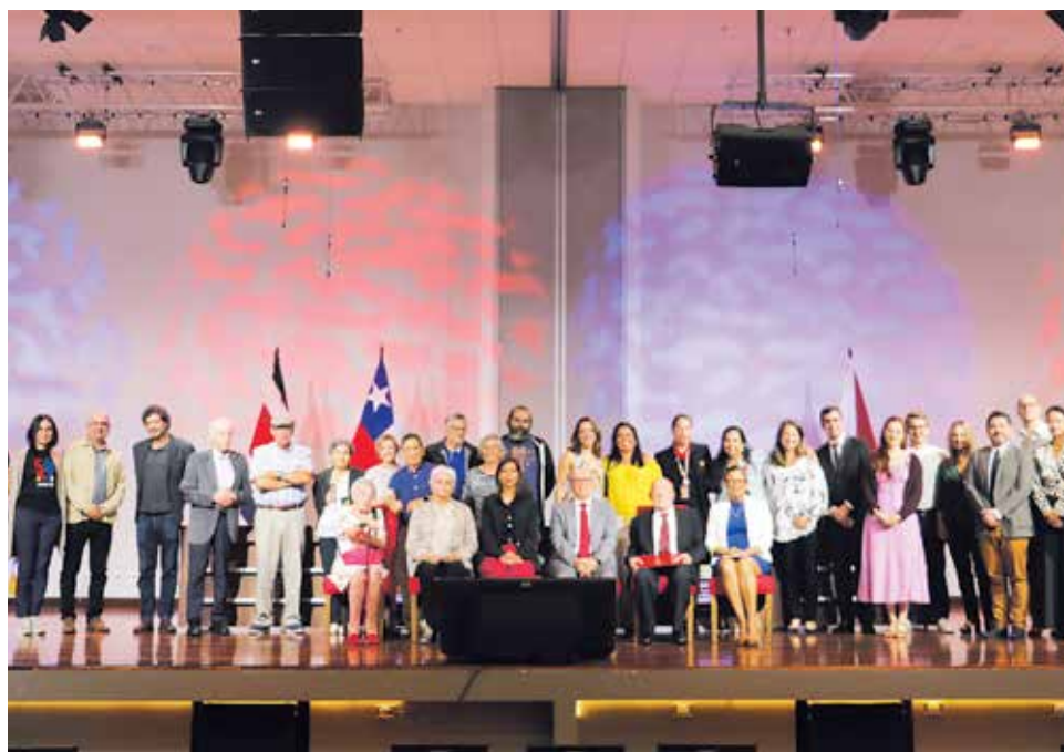
La UNA brindó homenaje a los chilenos que con su aporte ayudaron a la consolidación de la institución desde sus cimientos.

“En la década de los 70 nuestra América estaba sumida en la incertidumbre y el dolor ante la avanzada de regímenes de facto, a lo largo del continente, inspirados en doctrinas de seguridad nacional y cuya violencia es hoy parte de los estudios de restauración, memoria y defensa de los Derechos Humanos. La toma del poder en Chile, el 11 de setiembre de 1973, conmovió a nuestro país, que asistió a ese suceso mediante informaciones periodísticas que con imágenes sobrecogedoras editorializaban sobre la tradición democrática