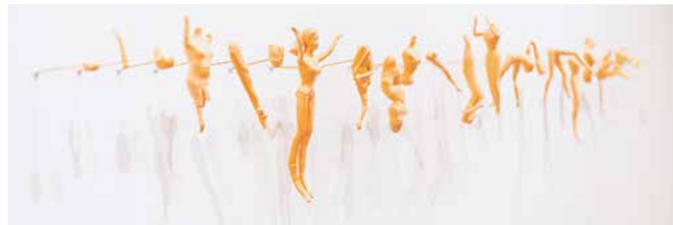
Sin título. Karla Herencia. 2022