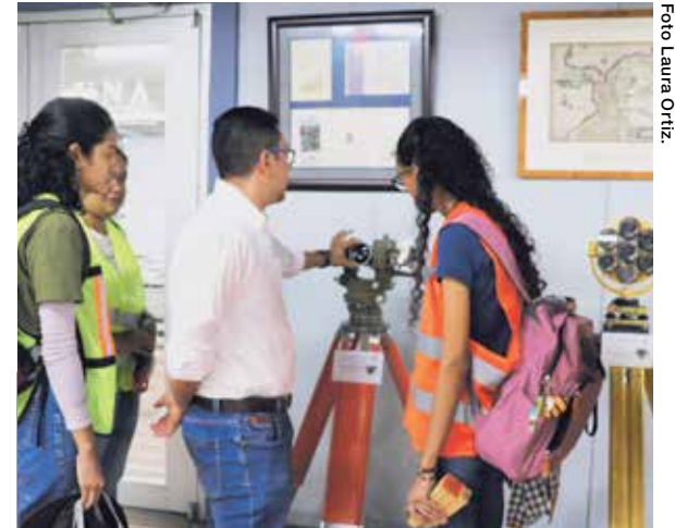
16 instrumentos sobre la historia técnica e instrumental en celebración de los 50 años de la fundación de la Escuela de Topografía, Catastro y Geodesia de la UNA.

Picado, destacó también el papel fundamental que desempeñan los profesores, investigadores y alumnos de la