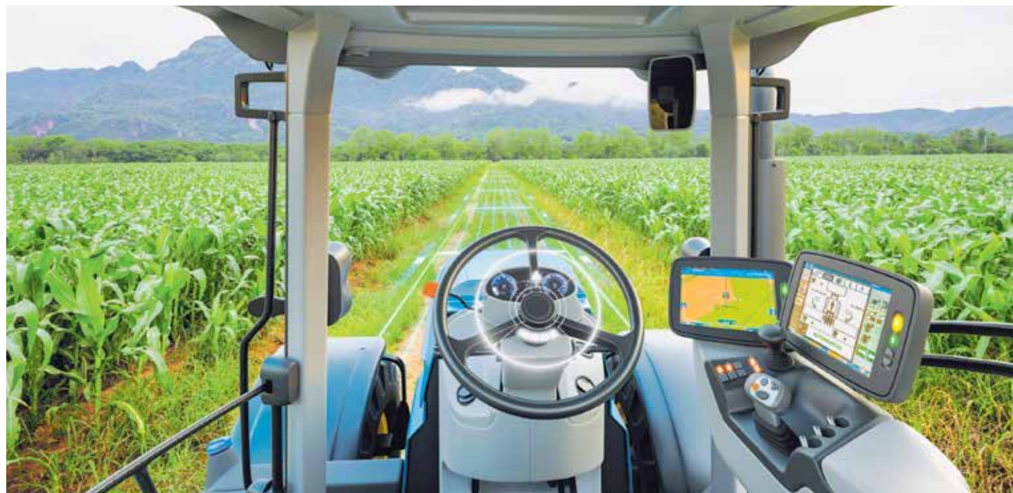
El uso de la IA en la agricultura puede contribuir a la optimización de cultivos, la identificación de enfermedades en plantas, el mejoramiento de la producción agrícola y la seguridad alimentaria.

El análisis de datos y prospectiva de la investigación y construcción de escenarios futuros que permitan la anticipación de