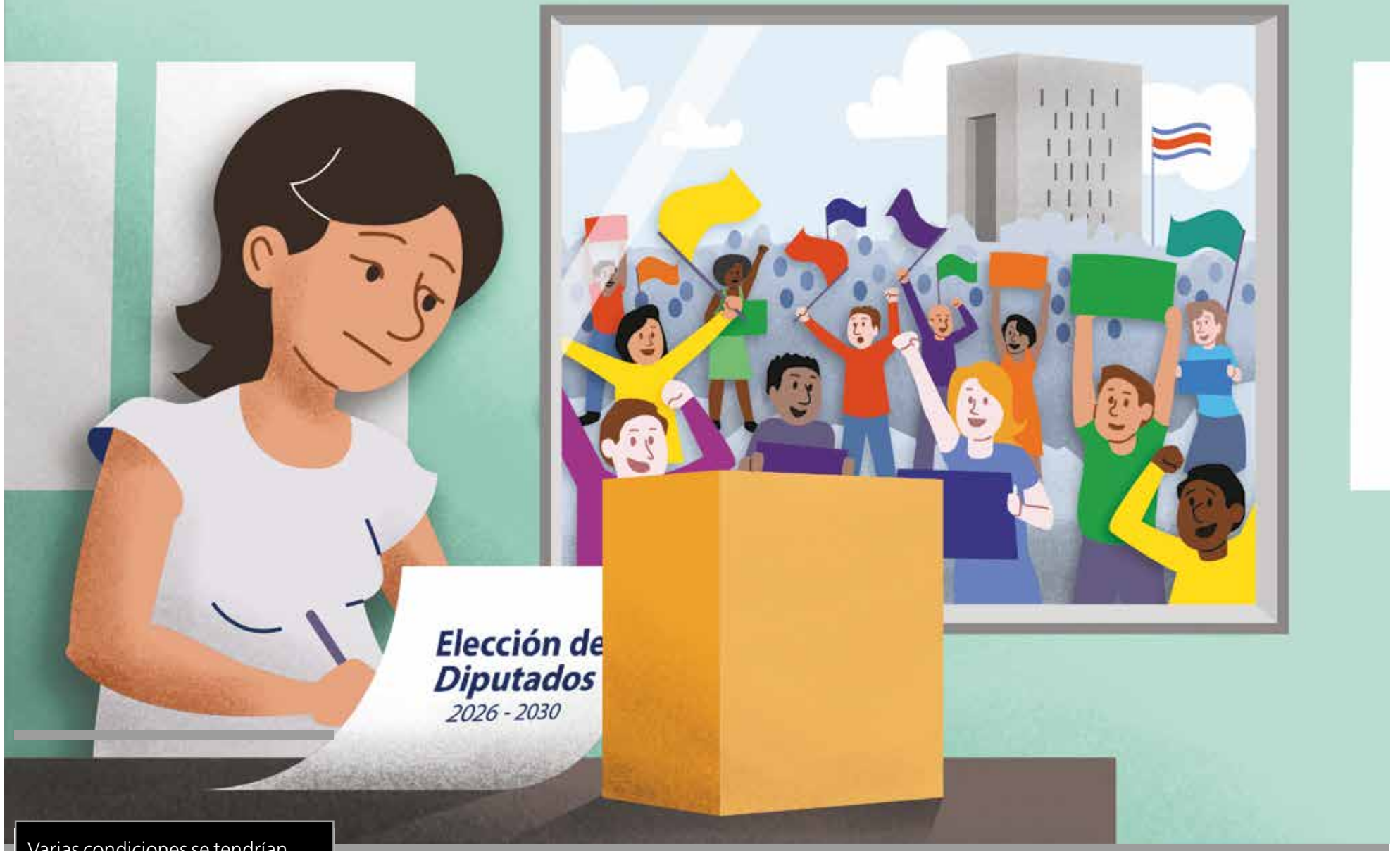
Ilustración Jeisson Sibaja Campos

Varias condiciones se tendrían que cumplir en Costa Rica para que un solo partido político alcance una mayoría calificada en la Asamblea Legislativa y promueva, desde ahí, reformas profundas en la gobernanza del país. El comportamiento histórico de esta elección, la tendencia de las últimas votaciones, la fragmentación política actual y el mismo sistema de elección—dicen los expertos—hacen prever la improbabilidad de que una sola agrupación elija 38 diputados o más en el 2026.