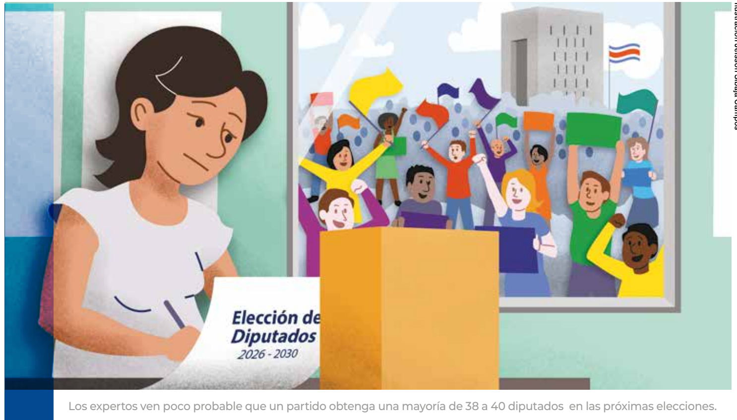
Los expertos ven poco probable que un partido obtenga una mayoría de 38 a 40 diputados en las próximas elecciones.

Entonces, para cualquier gobierno, contar con una mayoría parlamentaria sería un anhelo innegable. “Las grandes mayorías favorecen mucho el tema de la legislación”, apuntó Edel Rosales. Esto podría reflejarse, por ejemplo, en la posibilidad de aprobar vías rápidas para el trámite de proyectos, lo que evitaría que el texto pase por una comisión legislativa (donde se votan mociones de fondo, se llama en audiencia a las partes y se dictamina a favor o en contra de una iniciativa) y que el texto pase de manera directa al Plenario.