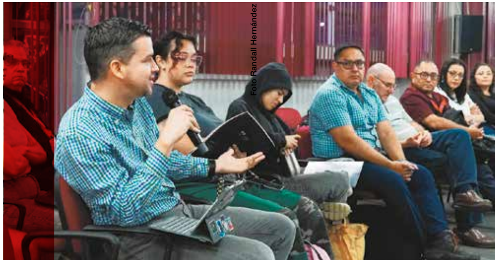
Nueve grupos dialógicos serán los encargados de motivar y organizar la participación de la comunidad universitaria en el V Congreso Universitario, una actividad que ha sido declarada de interés institucional por el Consejo Universitario.

Dado que el diálogo es un instrumento articulador mediante el cual se busca la participación de la comunidad universitaria,