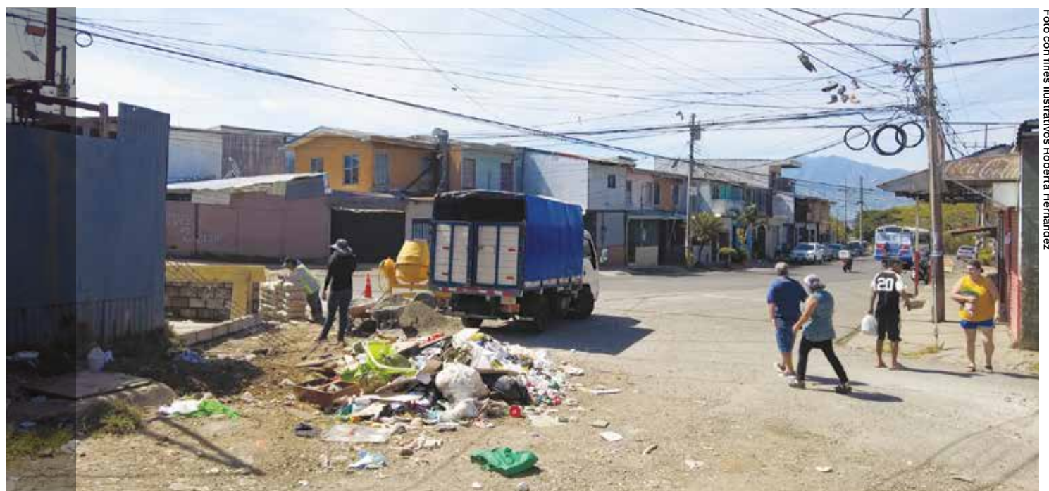
Cuando se dan recortes en la inversión social y se prioriza el pago de la deuda, se provoca un retroceso social muy importante que conlleva consecuencias negativas para toda la población en el corto y mediano plazo.

Aseguran que la inversión en educación es motor de movilidad social y formación de mano de obra capacitada, base para la competitividad y el cierre de brechas. “Urge una política pública de educación para sacarnos del estancamiento en el que estamos, al igual que en salud y en seguridad ciudadana, sin descuidar la reactivación económica interna de la economía local” concluyó Otoy.