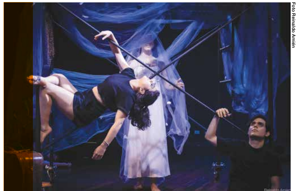
El teatro no solo enriquecen la identidad cultural de un país, sino que también crea empleo, impulsa el turismo, contribuyen a la transformación social y fomentan la reflexión crítica.

Actividades como el teatro no solo enriquecen la identidad cultural de un país, sino que también crean empleo, impulsan el turismo, contribuyen a la transformación social y fomentan la reflexión crítica, a través de la producción y distribución de contenido artístico y transformador. Los espectáculos en vivo, festivales y eventos culturales generan espacios de segregación,