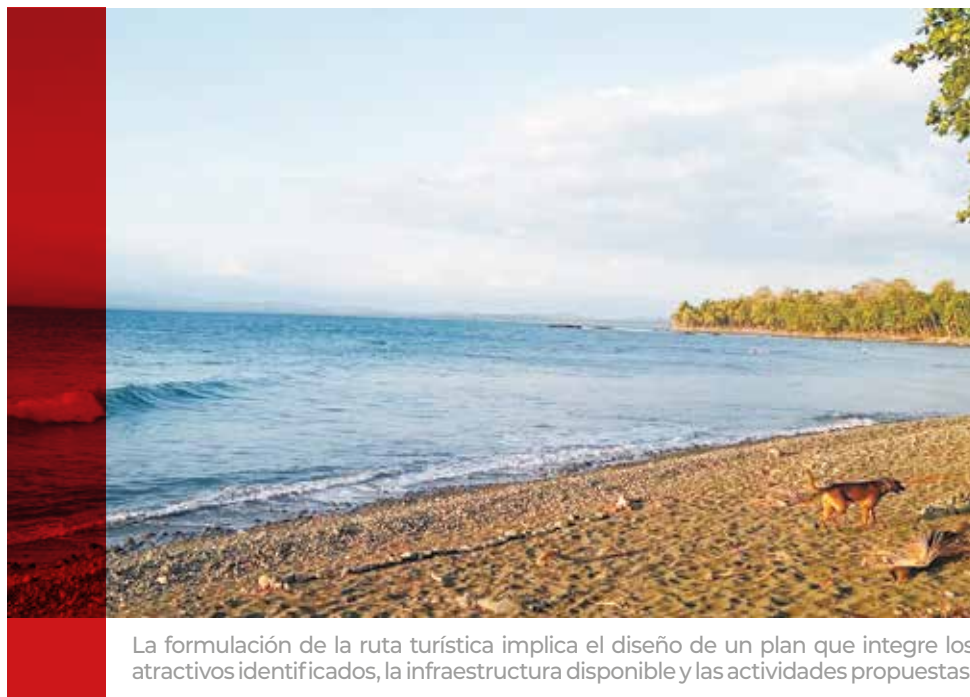
La formulación de la ruta turística implica el diseño de un plan que integre los atractivos identificados, la infraestructura disponible y las actividades propuestas.

Subrayó que Corredores cuenta con atractivos como territorio indígena, de alto valor cultural, cataratas, cavernas, así como emprendimientos de personas que hacen exportaciones de productos como el rambután.