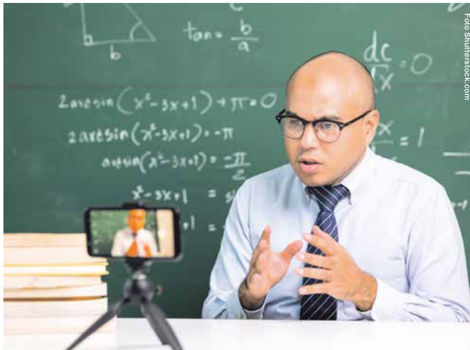
De acuerdo con datos del programa del Estado de la Educación , solo 1 de cada 5 docentes tenía competencias digitales avanzadas para desarrollar sus programas de estudio durante la pandemia.

Para Brenes, es importante que los docentes se comprometan con la nivelación académica y la recuperación educativa.