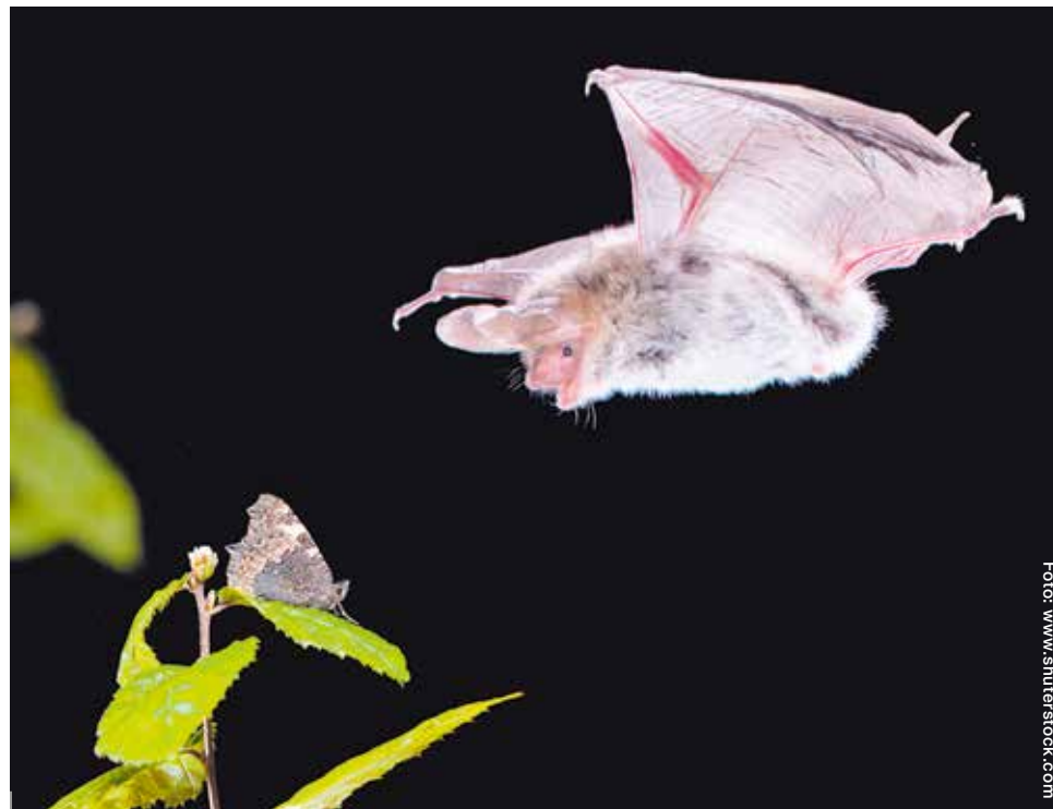
Entre los grupos de murciélagos seleccionados como modelo de estudio destacan los insectívoros aéreos, los cuáles se caracterizan por su sofisticado sistema de sonar que les permite capturar insectos al vuelo.

Para la investigadora, este estudio permitirá documentar las respuestas