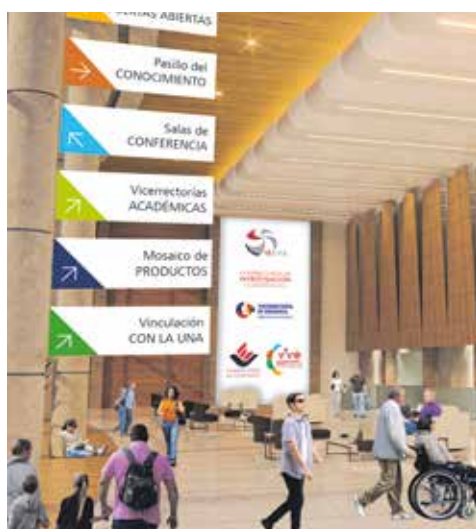
Los visitantes de la I Feria Virtual UNA se encontrarán con esta recepción. Desde aquí podrán acceder a las diferentes áreas temáticas que se estarán exponiendo.

El evento servirá para que comunidades, sectores y usuarios conozcan las oportunidades