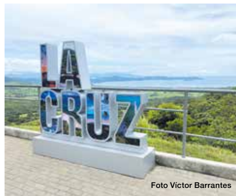
Conocer sobre las características del clima de La Cruz permite tomar mejores decisiones a la hora de sembrar, pescar y planear actividades productivas durante el año.

Conocer sobre las características del clima de la región permite tomar mejores decisiones a la hora de sembrar, pescar y planear actividades productivas durante el año. Estas actividades se enmarcan en el proyecto interuniversitario de acción social VarClim, financiado por Consejo Nacional de Rectores (Conare), con una duración de 2 años.