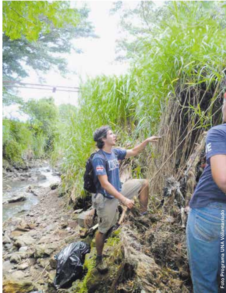
Las dimensiones del desarrollo sostenible abarcan los aspectos económico, ambiental y social. Programas como UNA Voluntariado cumplen una función importante dentro de los esfuerzos institucionales por dar cumplimiento a la Agenda 20-30 para el Desarrollo Sostenible.

Desde el Programa Investigación, Arte y Trasmidia (iAT), se realizan actividades con el objetivo de que el sector artístico se apropie de los ODS desde un aporte crítico. “Hemos encontrado una fisura entre la promoción cultural y lo que en la práctica es el apoyo al artista. Nuestro grupo de trabajo busca