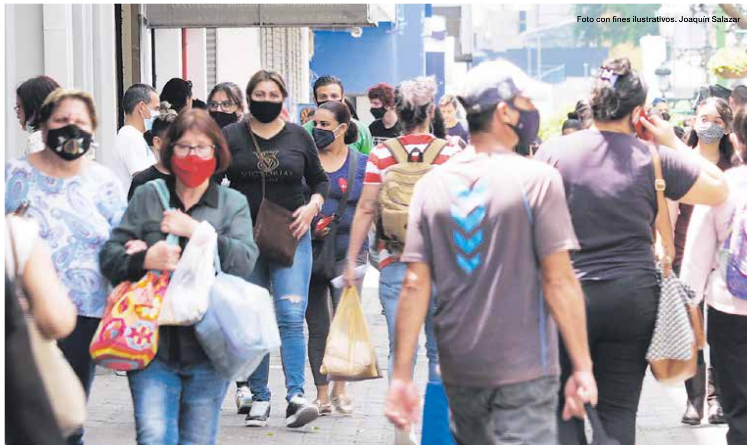
Foto con fines ilustrativos.

“¿Son estas situaciones nuevas en la vida de las mujeres y en la historia del