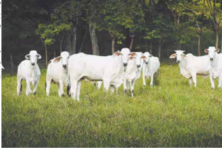
con fines ilustrativos

Es recomendable que el ganadero revise constantemente a sus animales para verificar que no hay heridas en el pelaje y si ese fuera el caso, proceder con la curación.