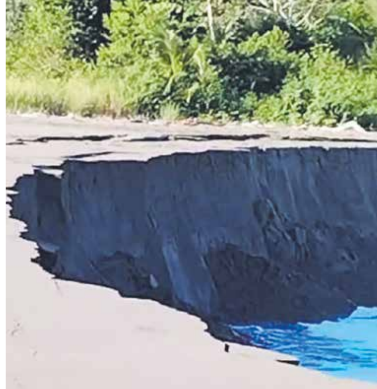
Investigadores de la UNA realizaron una gira de inspección al sitio, donde constataron que desapareció un segmento de playa de al menos 150 m 2 .