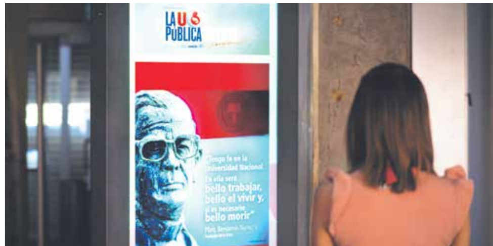
En la primera etapa del proyecto se han instalado 11 carteles digitales, en los diferentes campus. Uno de ellos se encuentra en la Biblioteca Joaquín García Monge.

De momento los carteles publicitarios, también conocidos como mupis , contienen información sobre eventos. Cada cartel se proyecta en un lapso de 10 o 15 segundos, y va