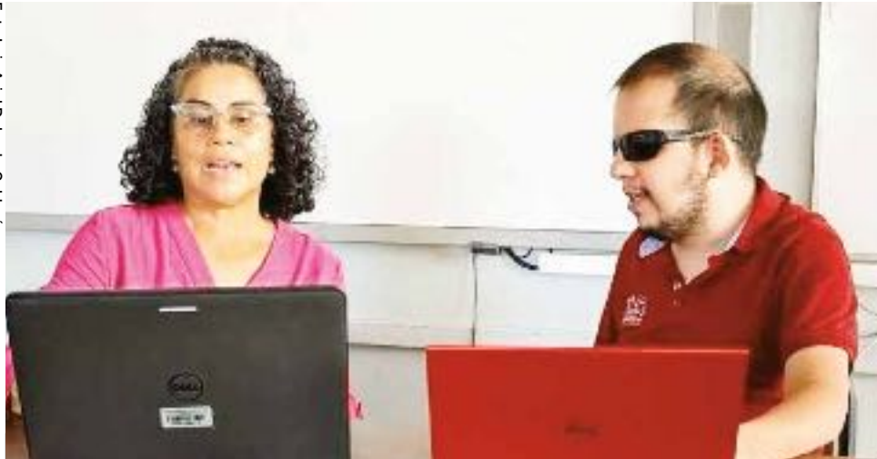
El proyecto es una oportunidad para el estudianto con discapacidad ingresa a la UNA.