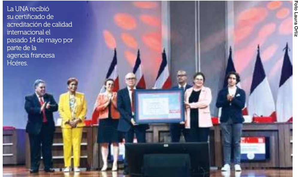
La UNA recibió su certificado de acreditación de calidad internacional el pasado 14 de mayo por parte de la agencia francesa Hcéres.