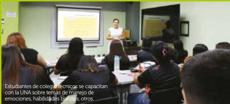
Estudiantes de colegio técnicos se capacitan con la UNA sobre temas de manejo de emociones, habilidades blandas, otros.

El evento contó con la participación de estudiantes de la especialidad de secretariado de los colegios técnicos profesionales de La Tigra de San Carlos y Umberto Melloni Campanini, de San Vito de Coto Brus, así como de seis estudiantes de los cursos pedagógicos de la carrera de diplomado, bachillerato y licenciatura en Educación Comercial.