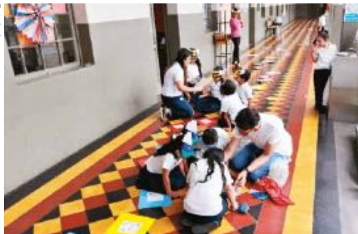
En centros educativos se llevan a cabo actividades interactivas que involucran directamente a estudiantes. Es el caso del Laboratorio de Didáctica e Innovación de las Ciencias Exactas y Naturales.