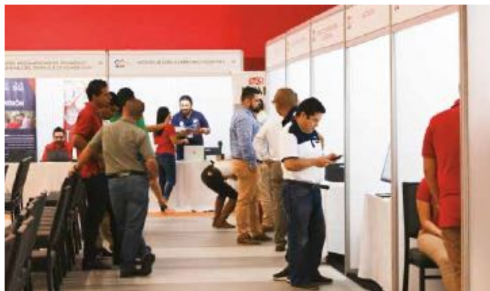
FUNDAUNA cuenta con más de 400 proyectos distribuidos en todo el país.

“Queremos reconocer y agradecer a todas las personas que hicieron posible el nacimiento de la Fundauna hace 20 años, a la luz de la Ley de Promoción del Desarrollo Científico y Tecnológico, y con el objetivo específico de apoyar el desarrollo y fortalecimiento de la vinculación externa de la Universidad Nacional a través de sus académicos. En este recorrido de dos décadas, nuestra organización ha administrado un sinnúmero de proyectos de distintas consultoría, productos y servicios, educación permanente, programas de posgrado, así como diversos proyectos de cooperación nacional e internacional, apoyando a los académicos para que sus iniciativas pudieran desarrollarse y cumplir con las necesidades de los usuarios finales”, dijo López.