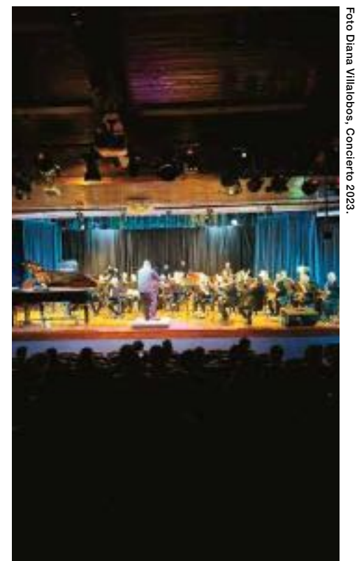
Concierto 2023.

Para conocer más detalles de estas actividades siga las redes sociales de UNA Producción de la Escuela de Música.