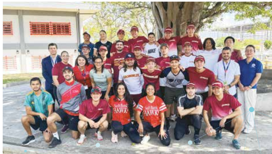
Programa de movilidad con la Universidad J.F. Oberlin, de Tokio, Japón. Visita a la UNA, en febrero 2024.

La vida de muchas personas en la UNA ha cambiado y cambiará para siempre gracias a estas oportunidades de interacción con el mundo dentro y fuera de la institución. Cada vez más, nuestro campus es un espacio cosmopolita y en su ambiente se respira esa sensibilidad cultural fundamental en la formación de nuestra comunidad.