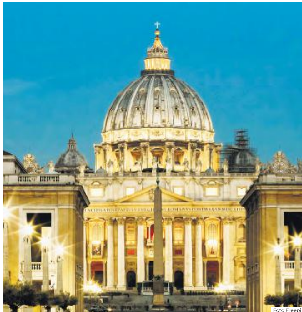
La Iglesia católica enfrenta retos de unidad frente a procesos de deshumanización que han sido denunciados por el papa León XIV.

El encuentro se da en el marco de la inauguración de la torre de Jesucristo en la Sagrada Familia y en momentos en que España se ha erigido en el ámbito mundial como una nación de acogida a la población migrante, tras la promulgación del Real Decreto que propone un proceso de regularización para que personas extranjeras obtengan un permiso de residencia y de trabajo legal en el país.